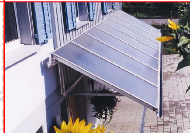
Capteur solaire à une façade

Le solaire thermique est l'utilisation du rayonnement solaire sous forme chaleur, chaleur utile pour la préparation d'eau chaude ou pour le chauffage.