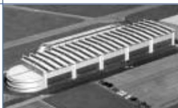
Aufnahme Schweizer Luftwaffe

Treffpunkt: Bahnhof Alpnach Dorf oder am Flugplatz (Pfortnerloge)